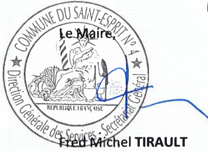
Fred Michel TIRAULT

Pour extrait certifié conforme. Fait au Saint-Esprit, le 10 Octobre 2024 .