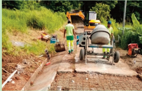
Travaux de traversée de chaussée quartier Placide (Juillet 2024)