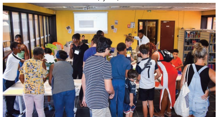
La Kreyochas, une chasse au trésor en kreyol, autour de notre patrimoine, proposée par l'Association Kreyogène. (1 er juin)