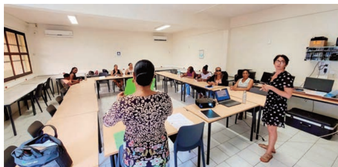
Une formation importante pour une meilleure connaissance des allergies alimentaires