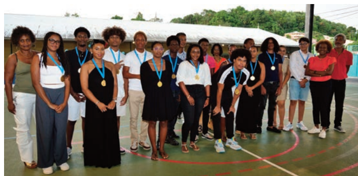
Une pluie de félicitations et des médailles offertes par le Maire et les élus