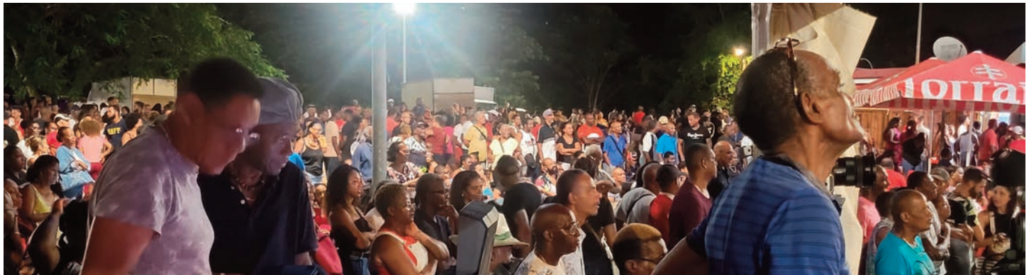
Une foule nombreuse assistait au show live