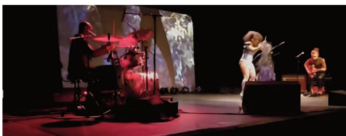
MamiSargassa 3.0 et ses guests (23 mars)