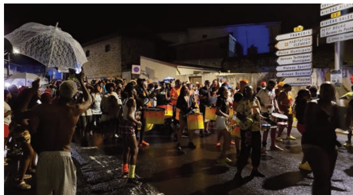
Vidé en pyjama dans les rues du bourg (14 février)