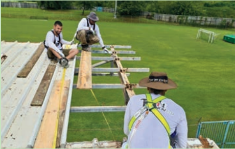
Pose d'une nouvelle toiture sur le stade André KABILE (Juillet 2024)