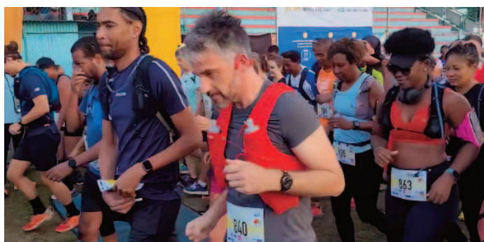
Départ de la course DÉKOLAJ 16 km - Randonnée PÉTÉ PIÉ 10 km