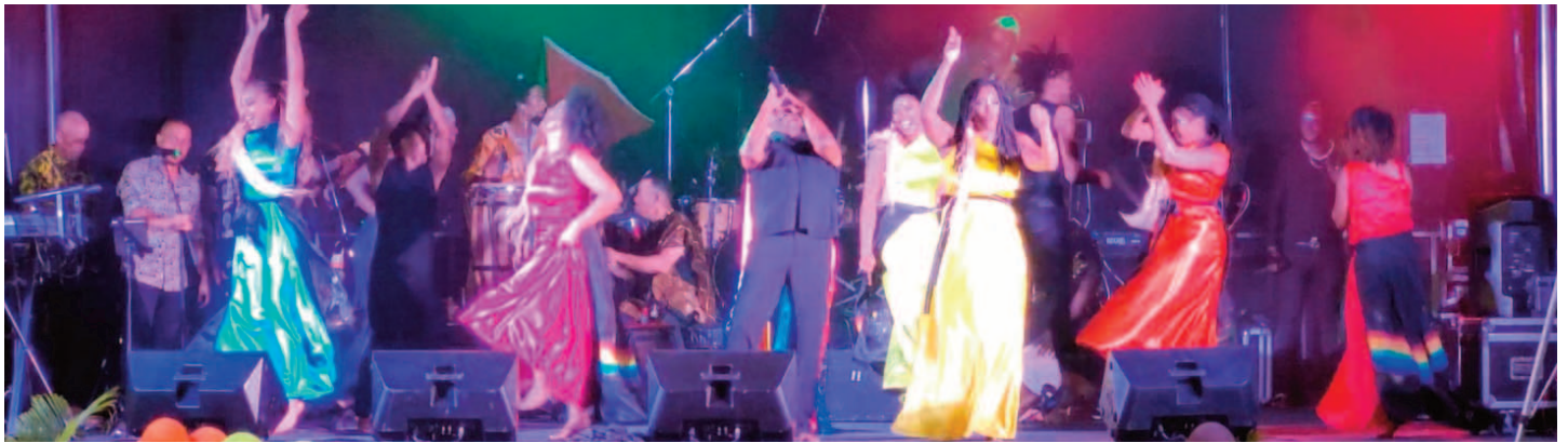
MOUVMAN KILTIREL EKANGA