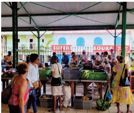
Le stand de fruits et légumes a fait le plein

Le traditionnel Marché de Pâques organisé par la Ville du Saint-Esprit, en partenariat avec l'Association 3V+, a connu une belle fréquentation. Artisanat, fruits et légumes, liqueurs, accessoires de mode, plantes etc, de nombreux produits étaient proposés à la vente, sans oublier la dégustation du délicieux matoutou, cuisiné dans la pure tradition, par les membres de l'association.