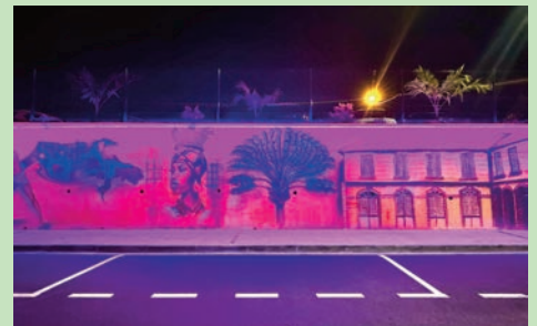
Éclairage de la fresque réalisée par Luc KABILE, artiste spiritain - (Mai 2024)