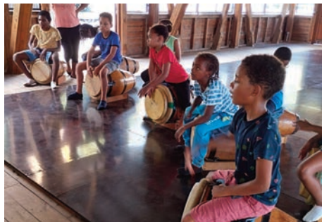
Découverte des percussions traditionnelles locales à l'Association TANBOU B ô Kannal