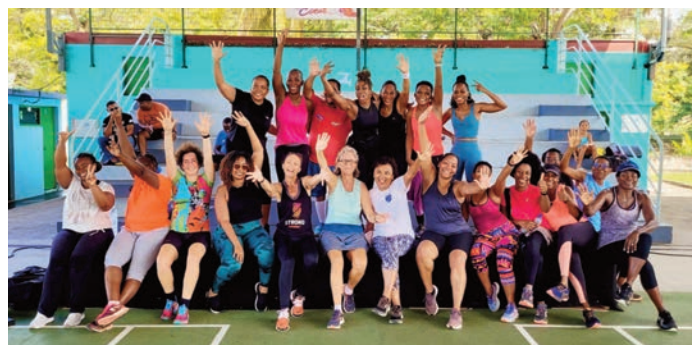
Petite photo souvenir. Bravo et merci à toutes et à tous pour votre participation !