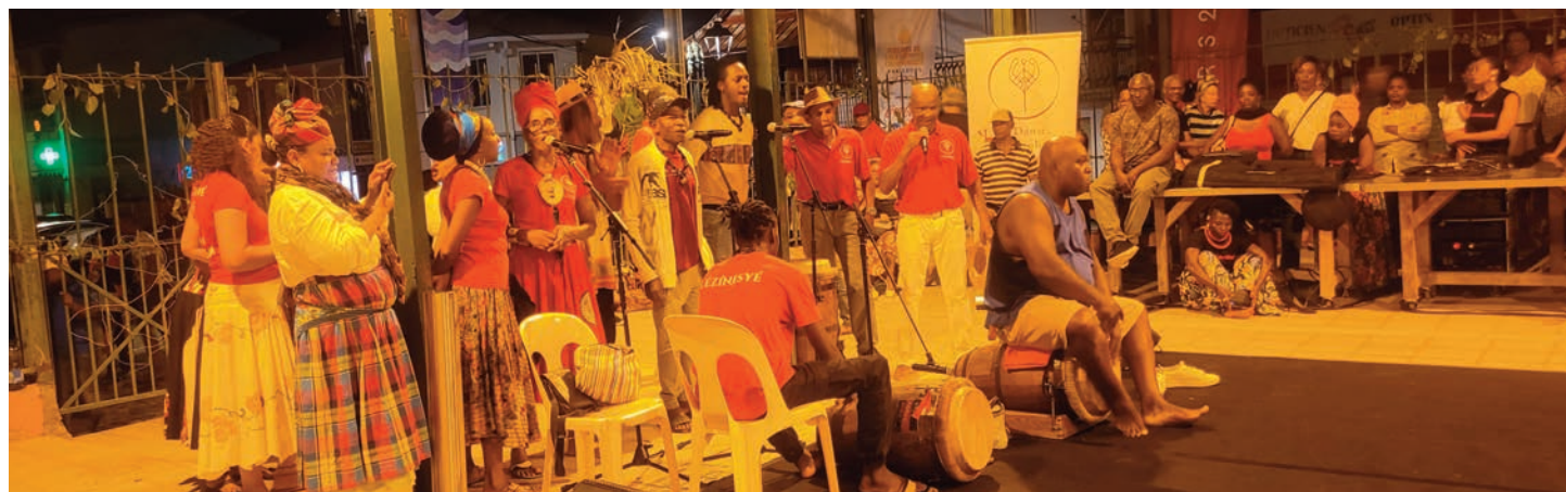
Soirée bèlè avec l'Association Lézinisyé au Marché couvert (21 mai)