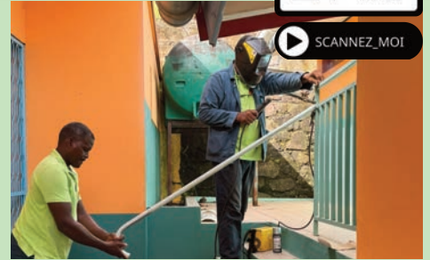
Pose d'une rampe de sécurité École de Grand Bassin (Juillet 2024)