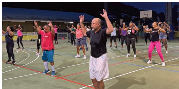
Les participants n'ont pas ménagé leurs efforts !