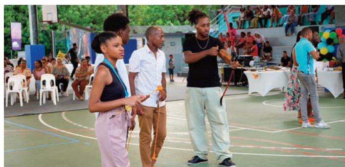
Le tir à l'arc, une activité sportive ludique proposée aux bacheliers, qui requiert cependant adresse et concentration