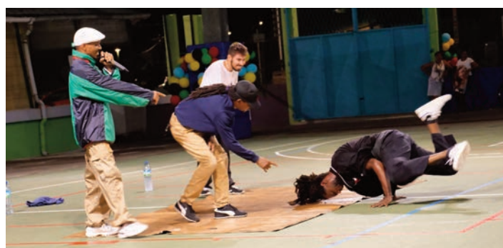
Le hip hop dans tous ses états avec le Crew "ZION BBOYZ". Une discipline qui fait son entrée aux Jeux Olympiques