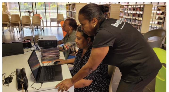
[Ti Gran Moun TV] initiation aux outils audiovisuels et à la réalisation de contenus proposée par Happy Silver (11 mars)