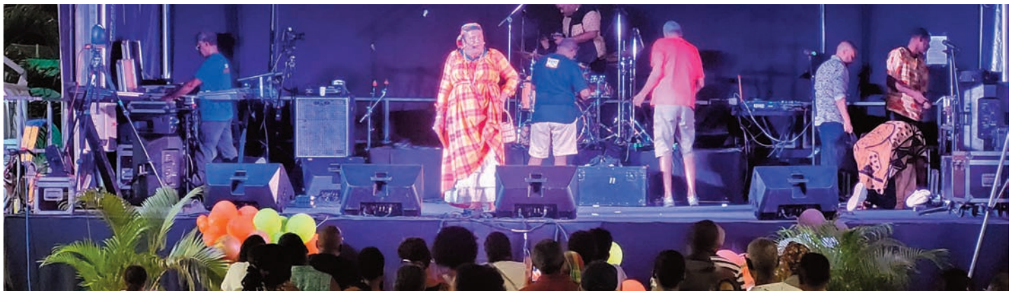
L'humoriste Thierry ADELE