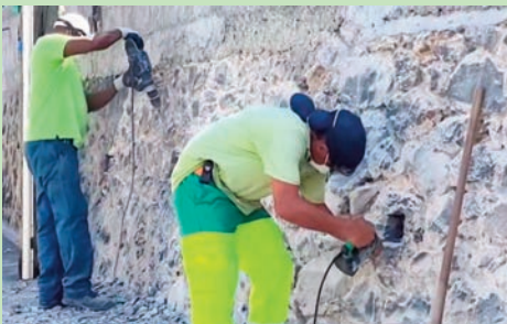
Préparation du mur de l'ancien collège par les agents des Services techniques - (Mars 2024)