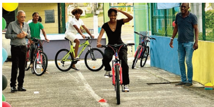
"Savoir rouler à vélo", mission accomplie pour nos nouveaux bacheliers !