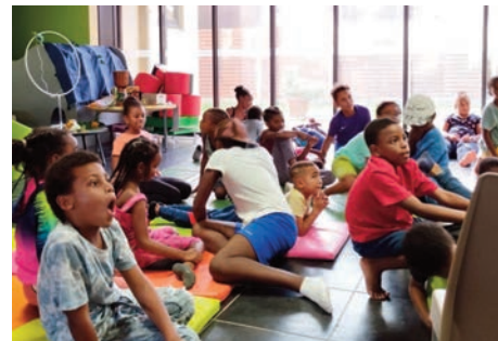
Atelier d'art thérapie à la Médiathèque Alfred MELON-DÉGRAS