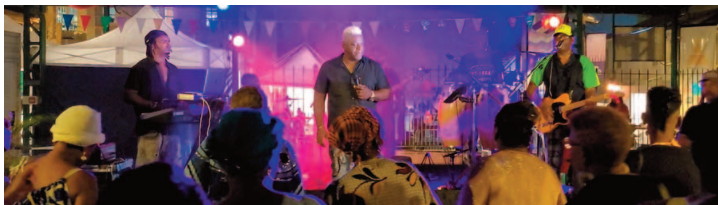
Le groupe MKG et ses invités lors du bal populaire au Marché couvert (25 mai)