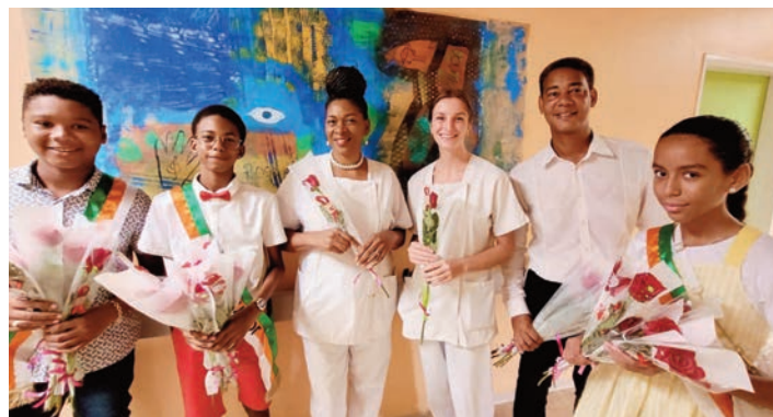
Les conseillers juniors et les élus ont offert des roses aux résidentes et au personnel de l'hôpital et des EHPADS de la Ville, le jour de la Fête des Mères (26 mai)