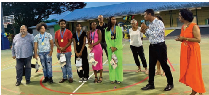
Le Maire et les élus récompensent les bacheliers

La cérémonie des bacheliers qui se tenait le mercredi 17 juillet 2024, a été une réussite, avec des discours inspirants, une ambiance festive et des moments de partage. Les 53 bacheliers ont été mis à l'honneur par le Maire et les élus, pour leur travail et leur succès. Les familles et les amis étaient présents pour soutenir les nouveaux diplômés et les encourager, créant ainsi une atmosphère chaleureuse et joyeuse. Un moment de détente et de convivialité bien mérité. Félicitations à tous nos lauréats qui ont décroché leur précieux sésame !