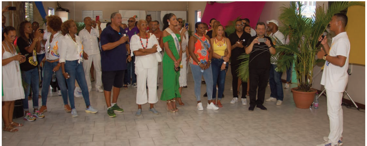
Allocation du Maire