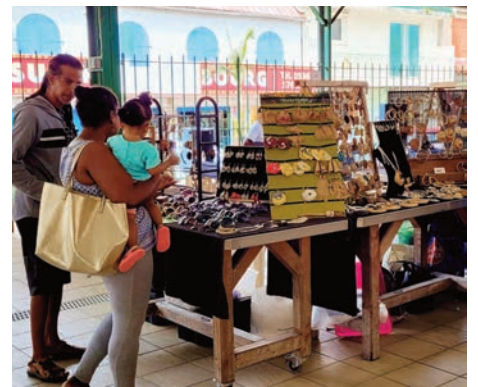
Un grand choix de bijoux artisanaux et autres accessoires de mode étaient proposés au public