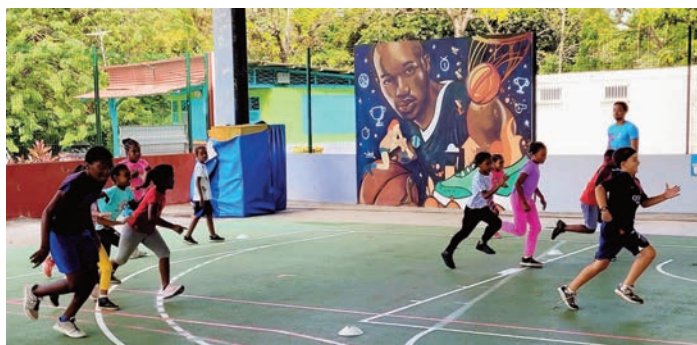
Initia-sports au Stade Pavilla avec les collaborateurs des Services des sports