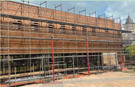
La Médiathèque fait peau neuve. Des travaux de bardage et d'étanchéité de la toiture ont été réalisés (Juillet 2024)