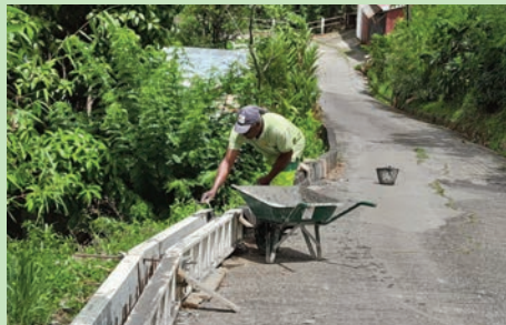
Pose de canalisations Quartier Fonds Coulisses (Avril 2024)