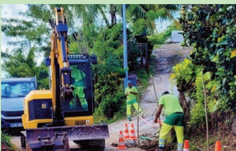
Recouvrement des caniveaux, chemin du Manguiers, quartier Morne Lavaleur - (Mars 2024)