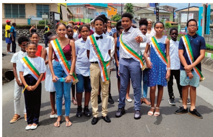
Le Conseil Municipal des Jeunes