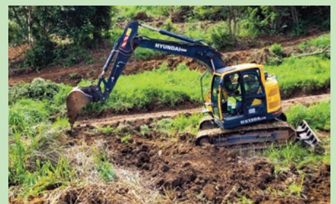
Nettoyage du site de la future station d'épuration implantée quartier L' Avenir (Février 2024)