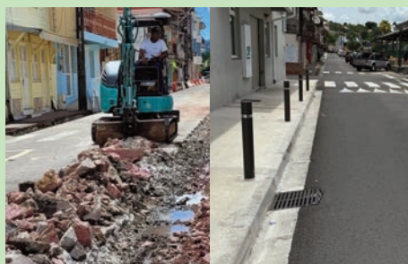
Réfection de la chaussée, rue du Capitaine Pierre-Rose (Février 2024 / Juillet 2024)