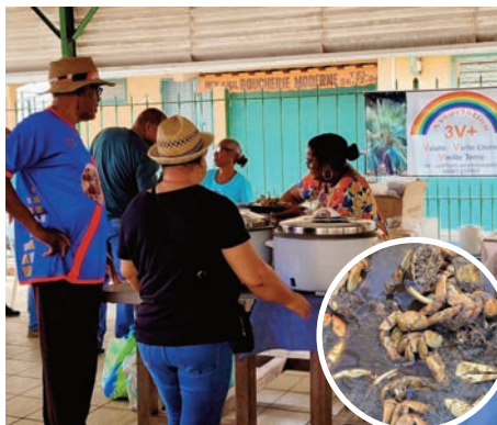
Plaisir gourmand, le matoutou à déguster sans modération