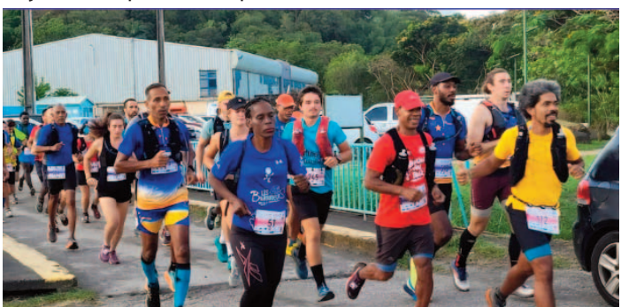
C'est parti pour la course SAM'KRAZ (22km)

Ce sont près de 700 personnes qui ont pris le départ des deux courses : SAM'KRAZ, DÉKOLAJ et de la randonnée PÉTÉ PIÉ, le 7 avril dernier, au Stade André KABILE. Autant dire que le succès était au rendez-vous de cet événement. Endurance et dépassement de soi pour les uns, promenade de santé pour les autres, à chacun sa passion ! Les retours des participants sont unanimes : ils attendent déjà avec impatience la prochaine édition !