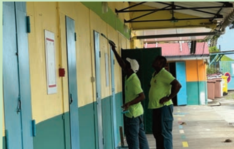
Travaux de peinture École de Grand Bassin (Juillet 2024)