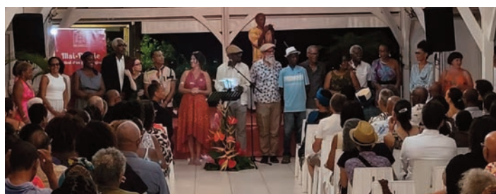
Membres de l'association Balisaille, poètes locaux et internationaux invités saluent le public ( 8 mai)