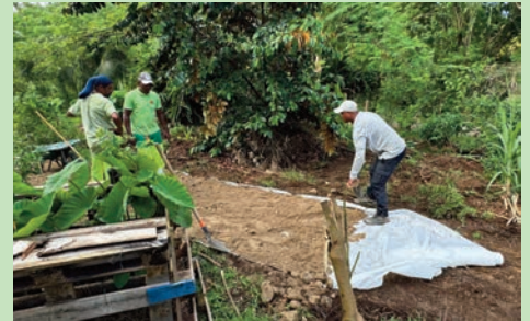
Aménagement du jardin partagé initié par le CCAS Parcours santé - (Juillet 2024)