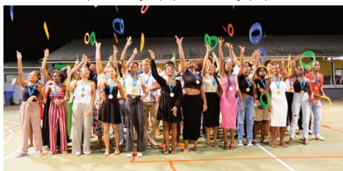
Clôture de la Cérémonie des Bacheliers en apothéose avec un splendide lâcher de cerceaux, aux couleurs des anneaux olympiques