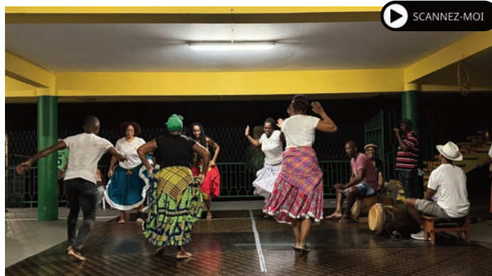
Animation bèlè proposée par l'association 3V+ avec le groupe APAMIA à l'école Raymond LABAT (26 juillet)