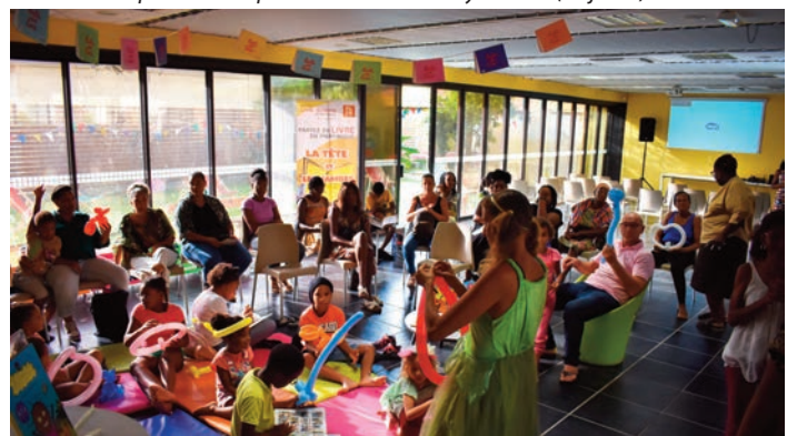
Goûter littéraire autour de Margaret ABOUET (5 juillet)