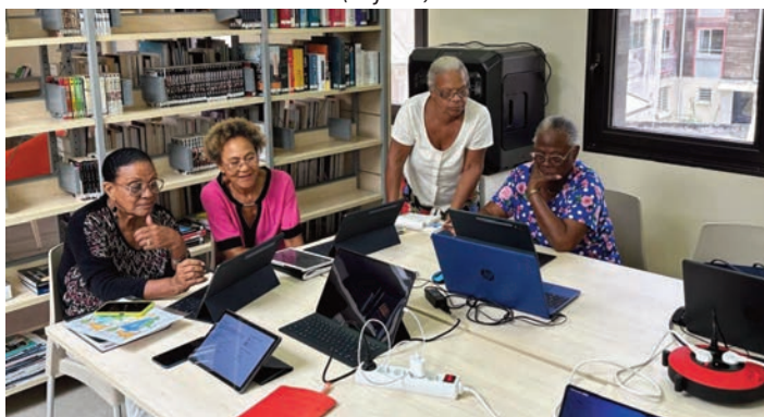
Club numérique seniors Seniors et connectés ? C'est possible ! (12 juillet)