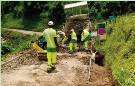
Réfection d'aire de retournement Quartier Grand Bassin (Avril 2024)