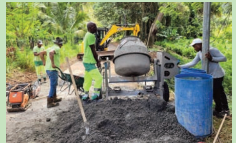
Réfection d'ouvrage hydraulique quartier Morne Babet (Avril 2024)