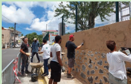
Restauration du mur de l'ancien collège par l'association REMPART - (Mars 2024)