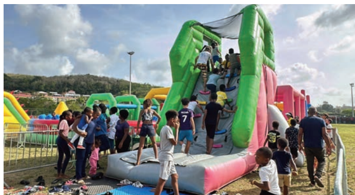
JWE LAND super parc, des attractions pour les plus jeunes sur le terrain Pierre LAMIC (18 mai)